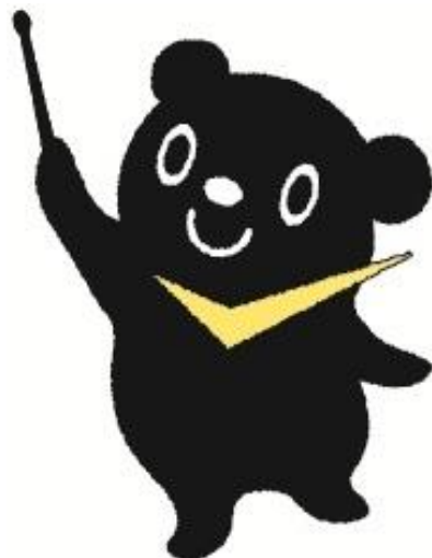
最低賃金制度のマスコット チェックマン