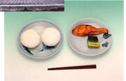
明治22年 当時の給食