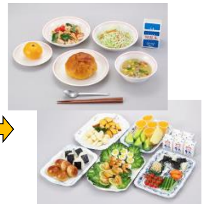
平成になってからの給食 献立の種類が増え、バイキング給食などが始まった。