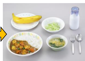
昭和52年の給食 給食に米を使った給食が始まる。