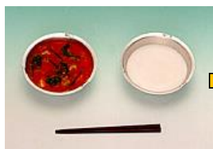
昭和22年 1月の給食 戦後すぐの給食 脱脂粉乳と トマトシチュー