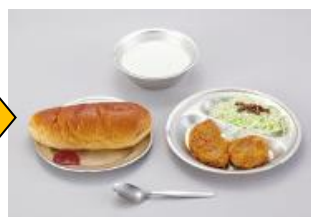
昭和27年の給食 お肉ではなく、鯨の肉などが使われていた。