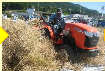
④耕運機で踏み、種を落とす