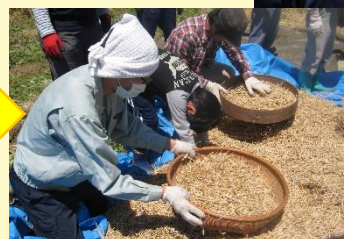
⑤ざるで、さやと種とをふるい分ける