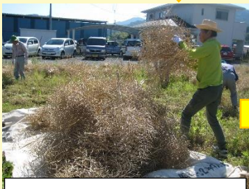
③乾燥した菜種を集める