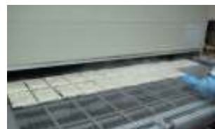
1ふくろずつトンネルフリーザーでれいとう