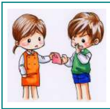
人のハンカチをかりない