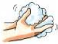
せっけんをつけて