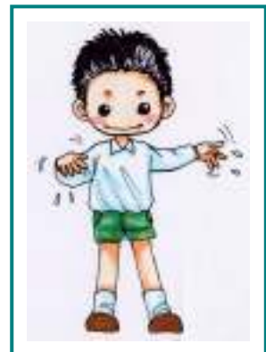
手をプルプルしない 水をとばさない