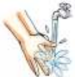
水でよく洗い流す