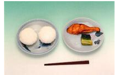
明治22年当時の給食