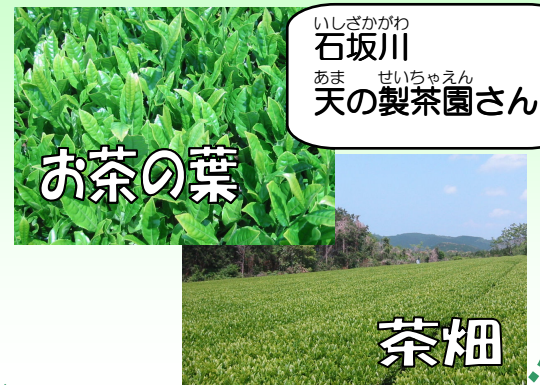
いしづかがわ 石坂川 あま せいちゃえん 天の製茶園さん