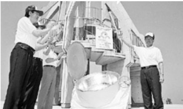
炬火採火式(平成11年)

採点競技は、郡市対抗競技であり8郡市以上の参加によって実施されます。公開競技は、参加が8郡市未満の競技となります。