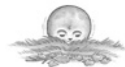
環境絵本「ひよっこりまーけっと」©川崎のぼる