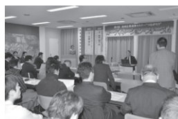
▲第2回セミナーの様子