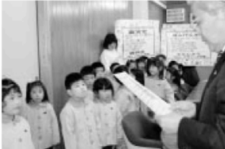
さくら保育園の保育園・幼稚園版環境ISO認証式

【地域全体丸ごとISO】 市役所や学校での環境ISOの取り組みをさらに進め、特に家庭版ISOは、新たな仕組みをつくり普及促進を図ります。また、保育園・幼稚園版、旅館・ホテル版などのISO制度の維持発展と合わせ、地域全体で、ISOの仕組みによる省エネ・省資源を進めます。