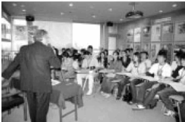
みなまた環境大学

水俣病の経験とその教訓から生まれた環境モデル都市づくりを、現地水俣で学ぶセミナーなどを実施し、持続可能な循環型社会づくりに貢献できる人材を育成します。全国から集まった受講生が各地域で取り組む活動による温室効果ガス削減の波及