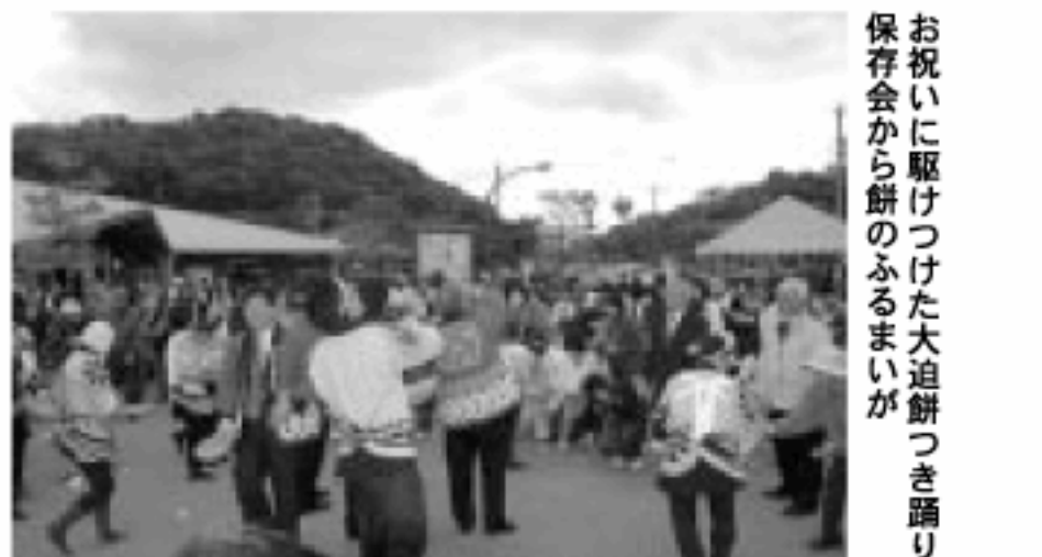
お祝いに駆けつけた大迫餅つき踊り保存会から餅のふるまいが