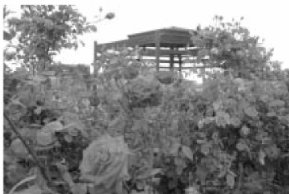
バラ園もグランドオープン。連休中が見頃とのこと。