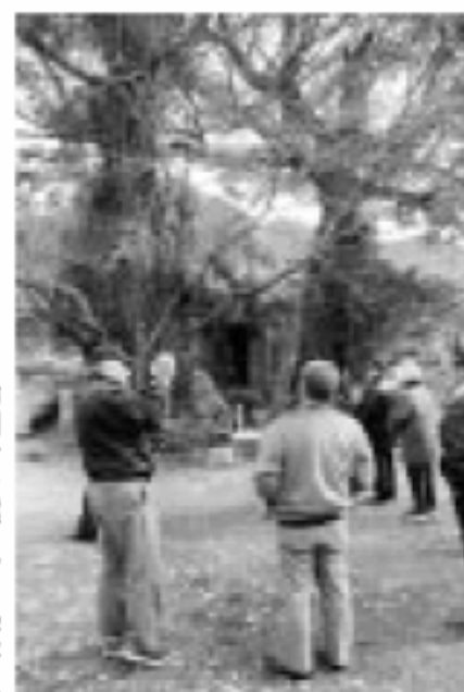
訪問者を案内する学芸員

集落全体を暮らしの博物館と見立てて、住民が地域の案内や体験プログラムなど主体的に活動することで、交流促進や地域経済への刺激を図ります。この住民と地域が元気になる取り組みを、指定地区を増やしながら、活動内容の充実をめざします。