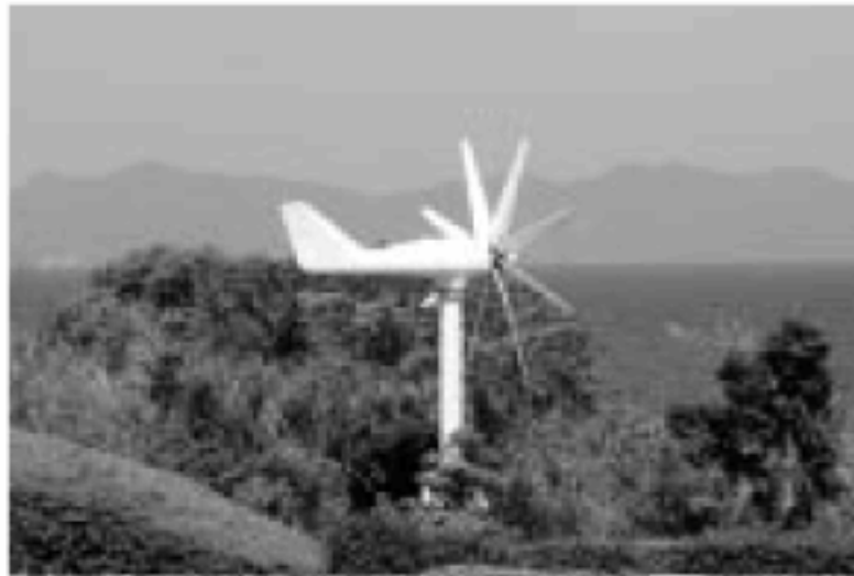
県環境センターの風車