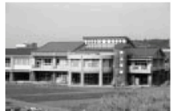
袋小学校の太陽光発電

今、再び注目されている太陽光発電。クリーンで無尽蔵の太陽の光エネルギーを直接電気に変える発電です。本市の環境モデル都市の取り組みでも、今年度から家庭への補助制度を設けて積極的な導入を進めていきます。今回は、太陽光発電についてのQ&Aをお届けします。