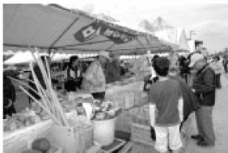
毎月第4土曜日開催のみなまた新鮮市