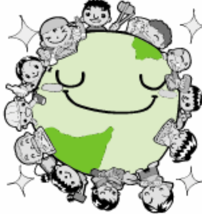
～暮らしに役立つエコ情報満載～