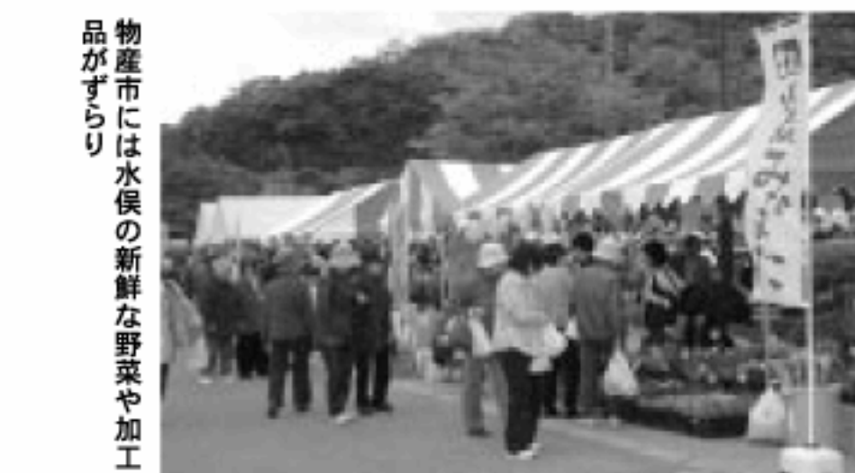
物産市には水俣の新鮮な野菜や加工品がずらり