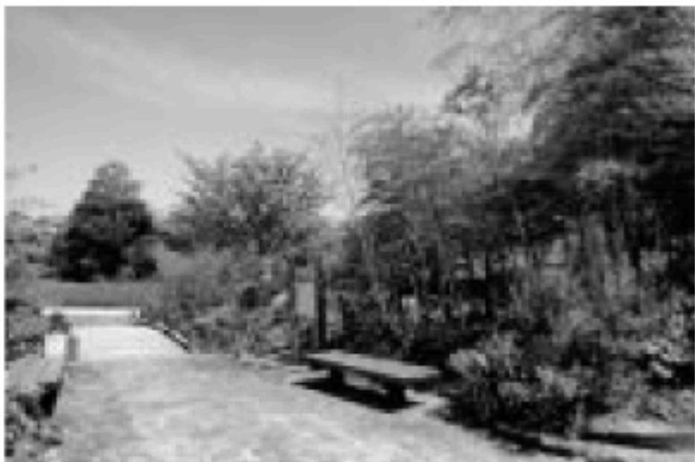
エコパーク水俣・竹林園

【地域資源を活用したバイオマスエネルギー】 竹やかんきつ類の絞りかすなどからバイオエタノール（植物原料のエタノール）をつくり、これを3%混ぜた混合ガソリンを製造して、公用車から民間への使用普及を図ります。また、副産物の販売等による地域の産業振興を同時にめざします。