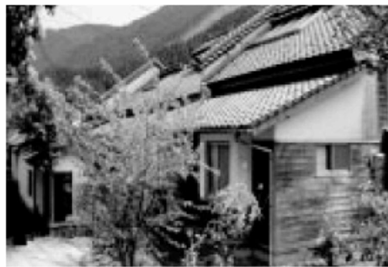
市営住宅亀首団地

新エネや省エネの様々な工法・設備等を導入したエコハウスの建設普及を図ります。また、市営住宅の建替えに際しても、公営住宅として先進的なエコハウス化をめざします。