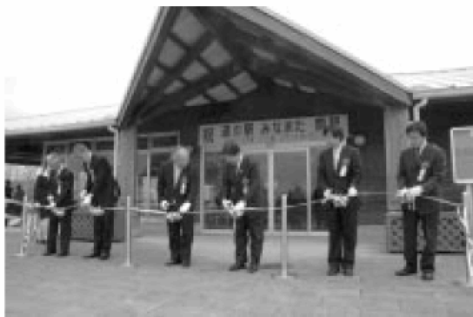
関係者らによるテープカット

またこの日は、バラ園と市内菓子店自慢の味を揃えた「みなまた土産もの菓子博」（17日まで）が同時オープン。9日には1日限定オープンのローズカフェが、また10日は阿蘇などで活躍するデュオ「VIENTO（ビエント）」のコンサートが開かれます。皆さんお誘い合わせのうえ、初夏の爽やかな1日をエコパークでお過ごしください。