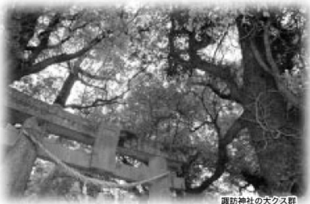
諏訪神社の大クス群

彼とすれ違うのを期待している自分がいます。挨拶の持つ力をしみじみ感じさせてくれます。そしてそれは、さわやかな香りを水俣に広げてくれるように思えるのです。