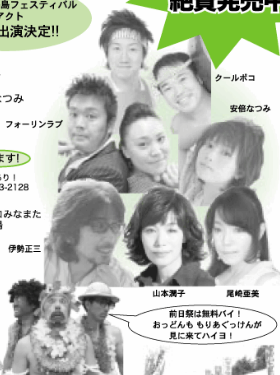
前日祭ゲスト やうちブラザーズ

日時 5月30日(土) 5月31日(日) 同時開催! 【みなまた港フェスティバル】 国土交通省・環境整備船「海輝」、海上保安庁・巡視船「はやと」が入港。 体験航海や見学ができます。また、陸上自衛隊8特太鼓の太鼓演奏もあります。 【みなまた物産展】 地元特産品の販売や展示、消防体験コーナーなど楽しみがいっぱい!