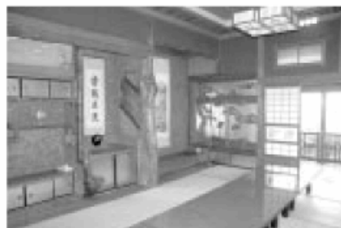
本館客室一例。博多織が織り込まれた壁や竹で編み込まれた天井などのほか、欄間、磨りガラスに至るまで見事な細工が施され、思わずため息がこぼれる。現在は食事会場として使用。