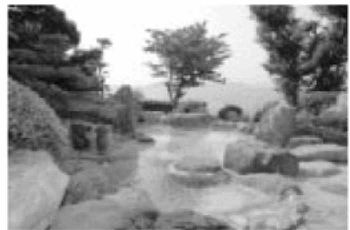
不知火海を一望できる華紋の湯(女湯)

不知火海を一望する大露天風呂や大理石、檜、ほらあなと趣向を凝らした温泉が自慢の宿。特に別棟「亀寿の湯」では、1枚ガラスの先に広がる海に浸かっているような錯覚を覚える。生け簀では旬の魚介類が海水で元気に泳ぐ。だから刺身がとっても新鮮!夏はハモしゃぶがオススメ。 【おすすめプラン】 日帰りプラン「ハモ会席」¥5千250円(税込)