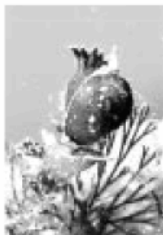
今年は丑年。当館ではウミウシの写真を展示中! 運が良ければ海で本物に出会えるかも!