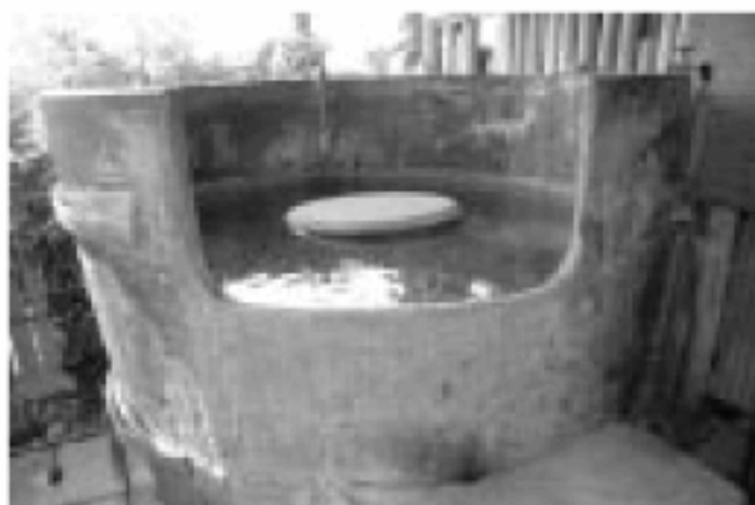
名物「庄助風呂」。大きな樽の中で潮風を受けながらのんびりと温泉を味わいたい。

湯の児温泉で一番古い宿とあって、徳富蘇峰が宿泊した菊の間や蘇峰蘆花の資料展示コーナーなど随所に歴史を感じる。この名物は、巨大な樽を使用した「庄助・小町風呂」や巨大なイワシ籠をすっぽりかぶせた貸切風呂(60分千200円)。小さな露天風呂付き客室はカッブルに人気で、海を眺めながら温泉で疲れを癒したいビジネスマンにも好評。 素泊まり¥5千円〜(税込)。