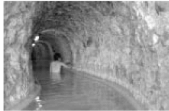
迷路のような洞窟温泉や所々岩盤むき出しの館内は探検気分ワクワク!子どもが喜ぶこと間違いなし!

天然の岩を掘り進んで造った洞窟温泉で有名な宿。洞窟の先には不知火海の大パノラマが広がる。部屋はすべて海に面しており、海側から見る築50年以上の磯館は、映画「千と千尋の神隠し」に出てくる「油屋」さながら。すべて部屋出しの食事はタチウオのしゃぶしゃぶが好評。宿泊は¥1万650円〜(1泊2食・税込)、立ち寄り湯(10時〜14時)は大人¥700円・子ども¥400円(幼児無料)