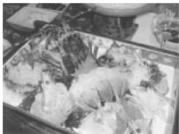
料理一例。魚好きにはたまらない!