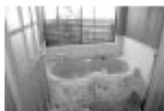
湯小屋付お部屋の内湯