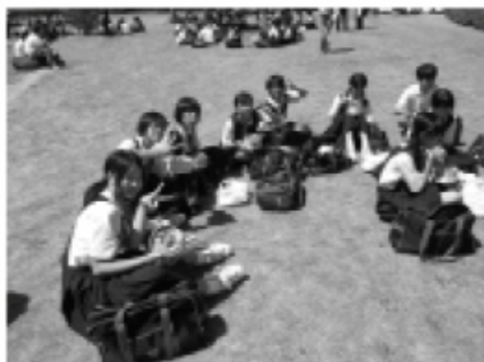
持参したマイ箸でゴミの出ない弁当を食べる中学生

：確かに、水俣で訪問客の受入時のごみを減らす、という意味では、証書の授与は有効ですが、水俣で日常的にごみを出しているのは、水俣に住んでいる私たち自身。水俣のごみを減らすうえで最も有効な方法それは、私たち一人ひとりの普段の生活の在り方を見直すことなのではないでしょうか。