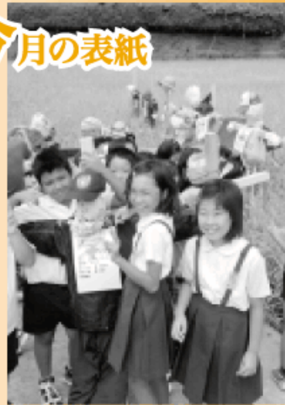
稲穂になったばかりの10月の田んぼ。今年も子どもたちの歓声の中、手作りかかしが田んぼに立ち並んだ。 (水俣第一小学校の4年生。陣内)