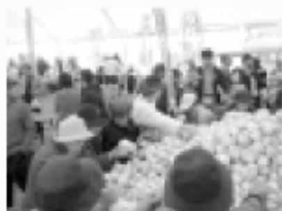
大好評! サラたまちゃん詰め放題