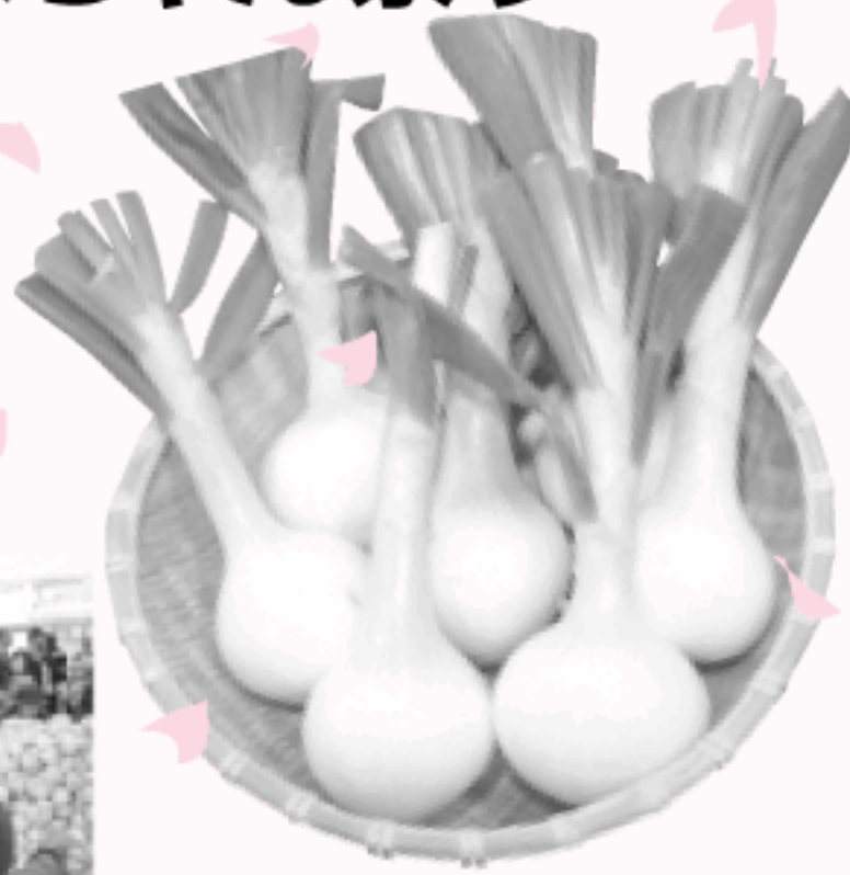
サラたまちゃん 新メニュー試食・販売