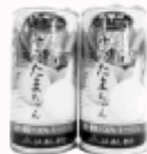
「飲むサラたまちゃん」早飲み大会