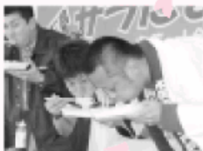
伝統の早食い大会