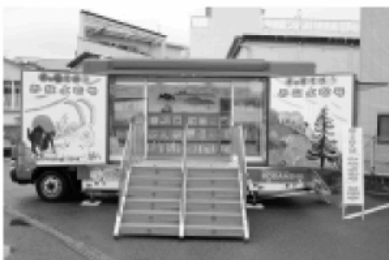
子どもたちにも大人気！「みなよむ」号