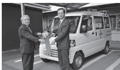
災害などの救援活動のために

12月5日、日本赤十字社熊本県支部から市に「赤十字災害救援車」が配備され、市役所玄関前で引き渡し式がありました。