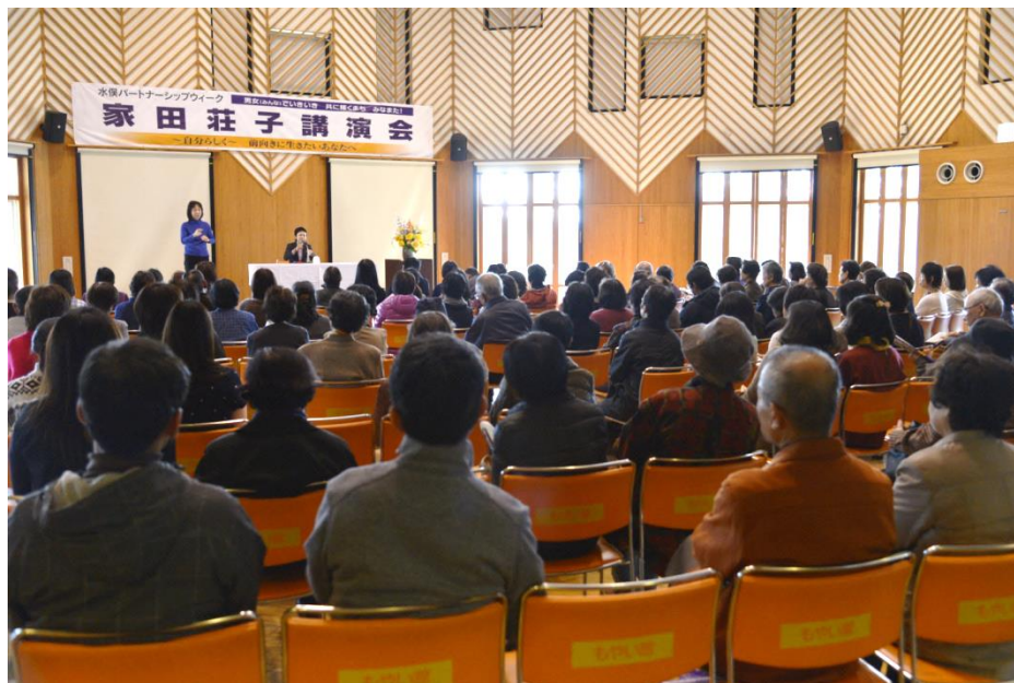
講演に聞き入る参加者