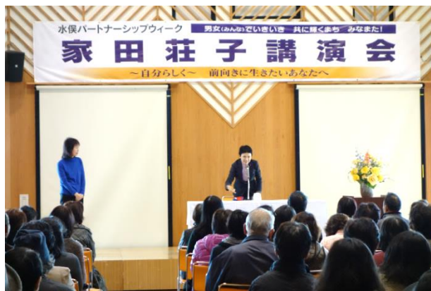
手話を交えて自己紹介