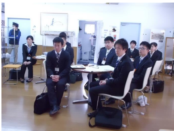
男性 9 名、女性 2 名の新人職員

法律が成立した社会情勢などを踏まえ、男女共同参画の必要性について考えてもらいました。