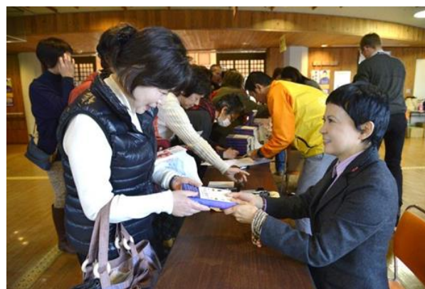
講演会終了後、書籍販売とサイン会