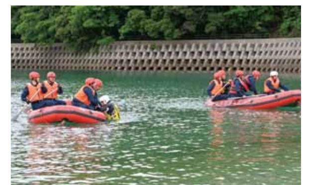
▲要救助者を引き上げる訓練を海上で行う参加者ら

近年の豪雨災害を踏まえ、水俣・芦北・八代警察署と県警機動隊の職員約30人が、水害を想定した合同訓練を5月26日に湯の児第2海水浴場で実施しました。当日は、県警機動隊指導のもとゴムボートの操作や乗船方法の点検が行われた後、海上で要救助者の救出訓練が行われ、災害時、孤立してしまう前に住民らを早めに避難させることの重要性を再確認していました。