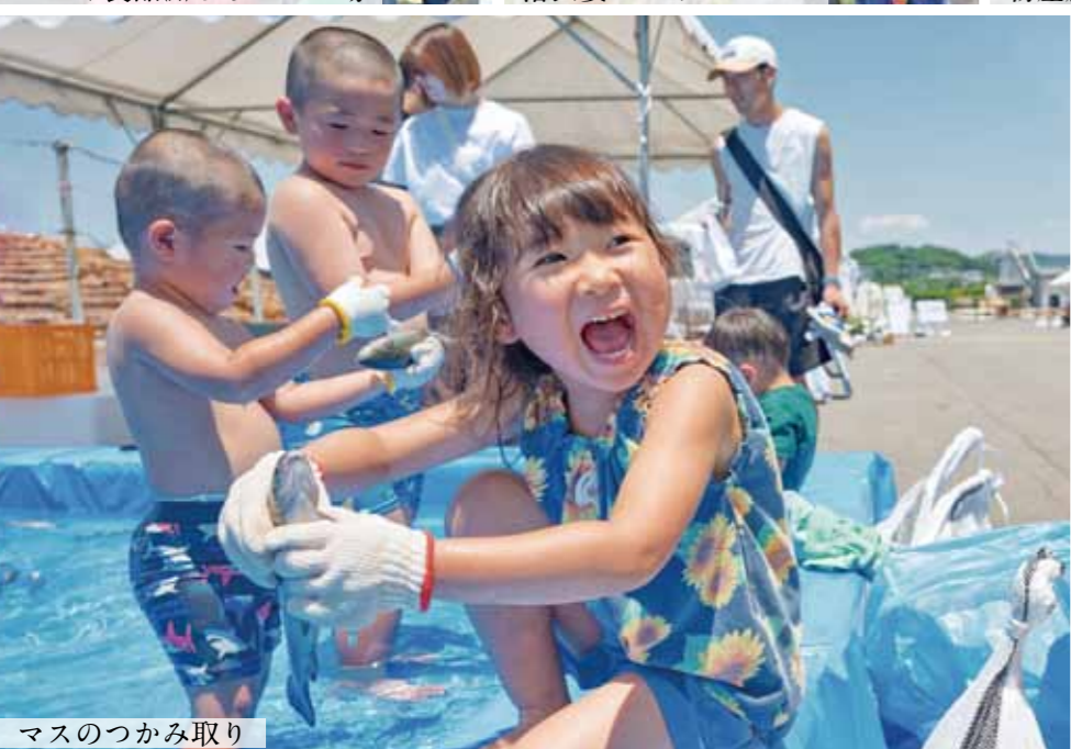
マスのつかみ取り