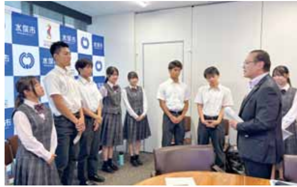
▲発表終了後に高岡市長からエールを送られる生徒たち