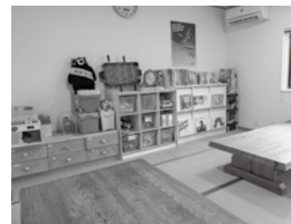
▲おもちゃなどが自由に過ごせます♪

学生の送迎支援など「こんなサポートがあったらいいな」を少しずつ形にしています。 また、子育てに関する勉強会を関係機関と共に毎月開催し、日頃から連携を深めることで必要な支援につなげられる体制づくりに努めています。助成制度の紹介や申請支援も行っており、相談いただければ何か力になれることがあるかもしれません。 地域を支えるために始めた活動ですが、食材の寄付など地域の皆さんに支えられており、人と人とのつながりの大切さを日々実感しています。心配なことがあってもなくても、誰もが気軽に立ち寄れる場所として、これから地域に寄り添いながら活動を続けていきます。