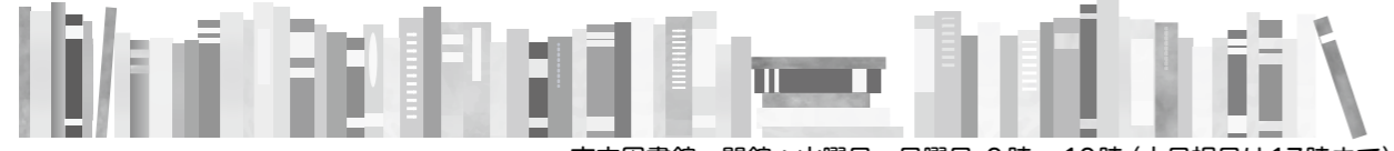
市立図書館 開館：火曜日～日曜日 9時～19時 (土日祝日は17時まで)

水俣に来てから、「ぜひ行ってほしい」とよく勧められたのが、湯の児温泉と湯の鶴温泉です。湯の児は亀、湯の鶴は鶴がモチーフになっており、どちらも長寿や縁起の良さを象徴していると聞いて、とても印象に残りました。