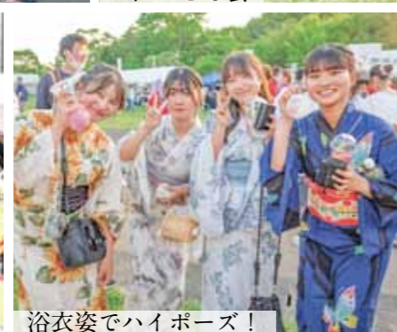
浴衣姿でハイポーズ!