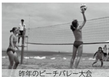
昨年のビーチバレー大会

7月18日・19日に、大安区で一番熱い「ビーチバレー大会」が開催されますよ～！日本でも人気のスポーツですが、現地には世界レベルの選手たちが集結。白熱したプレーと、観客席からの熱気あふれる応援を間近で楽しめます。大安区を訪れた際は、ぜひ会場に足を運んで、この熱気を直接体験してみてください！