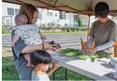
▲きょうだい二人三脚でタマネギ収穫 ▲朝採れのスイートコーンを畑で直売