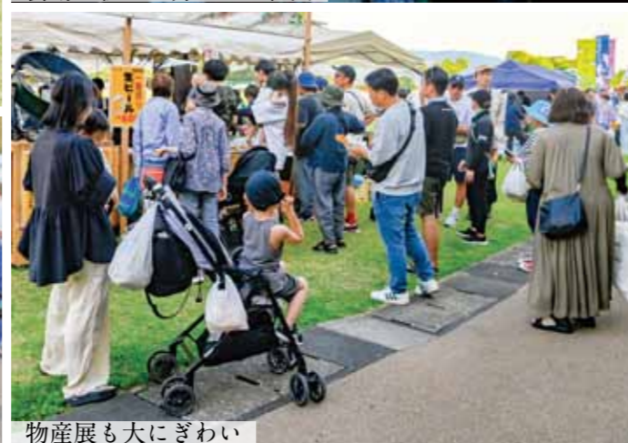
物産展も大にぎわい

水俣商工会議所などで行う実行委員会が5月30日、31日の2日間、エコパーク水俣で第71回恋龍祭を開催しました。両日も晴天に恵まれ、総踊りでは参加者がそろいの衣装に身を包み、息の合った華やかな踊りを披露しました。パレードでは、参加者が「わっしょい! わっしょい!」と威勢の良い掛け声とともに力強く神輿を担いで会場を盛り上げました。物産展や花火大会も合同イベントとして開催され、市内外から多くの来場があり、会場は終始熱気と笑顔に包まれていました。