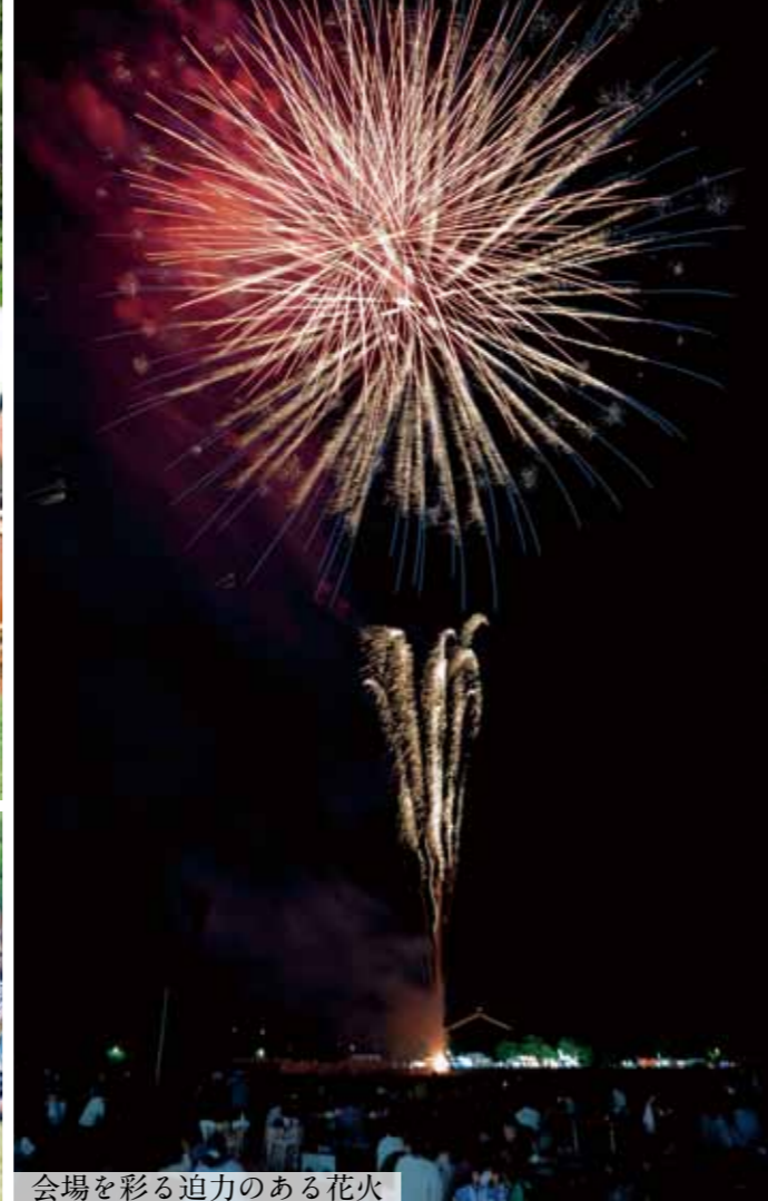
会場を彩る迫力のある花火