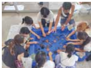
▲昨年のSDGs未来都市フェスタで海の生物とふれあう参加者

SDGsについて楽しく学ぶ「SDGs未来都市フェスタ」を 8/22(土)に市総合体育館で開催します。ごみ分別収集などの 環境保全活動で全国的に有名な水俣市ですが、人口減少や 少子高齢化などの課題にも直面しています。SDGsが国連 総会で採択された2015年の翌年に誕生したアカデミアでは、 次世代人材育成などSDGsの考え方に基づく事業を展開して います。ぜひ会場でSDGsを身近に感じてみませんか？