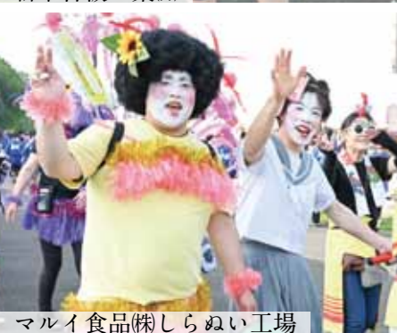
マルイ食品(株)しらぬい工場