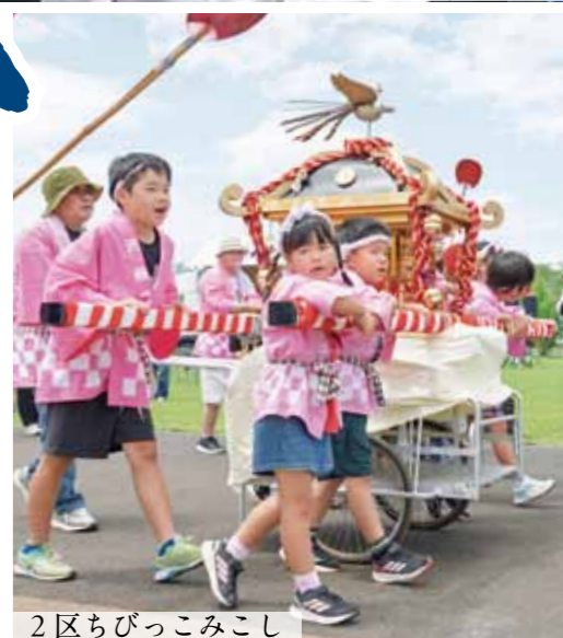
2区ちびっこみこし

水俣商工会議所などで行う実行委員会が5月30日、31日の2日間、エコパーク水俣で第71回恋龍祭を開催しました。両日も晴天に恵まれ、総踊りでは参加者がそろいの衣装に身を包み、息の合った華やかな踊りを披露しました。パレードでは、参加者が「わっしょい! わっしょい!」と威勢の良い掛け声とともに力強く神輿を担いで会場を盛り上げました。物産展や花火大会も合同イベントとして開催され、市内外から多くの来場があり、会場は終始熱気と笑顔に包まれていました。