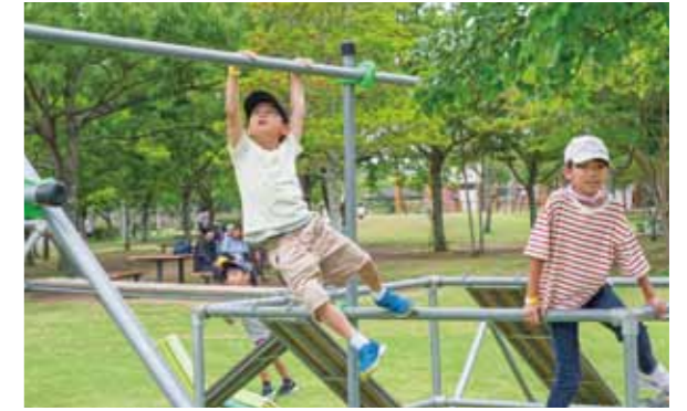
▲ゴールまであと少し！真剣な表情で一歩ずつ前へ

アルティメットやパークール、スラックラインなど珍しい7種目を体験できるレアスポーツフェスティバルが5月24日、エコパーク水俣で開催されました。ハートリンク水俣主催。体一つで障害物を乗り越えながら効率良く移動するフランス発祥のパークール体験では、子どもたちが挑戦を繰り返しながらコツをつかみ「できた！見て！」と達成感いっぱいの笑顔を見せていました。