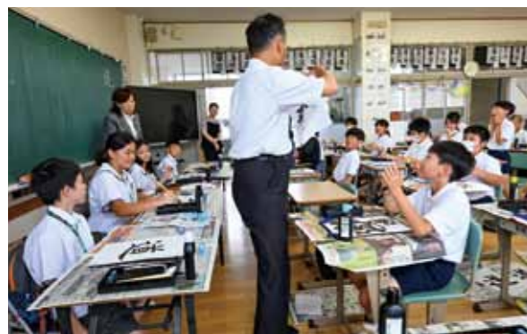
▲屏科実験高級中児童が書いた作品に感動する二小児童たち