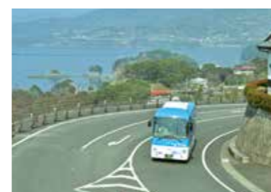
とんとん峠付近をバスは走ります