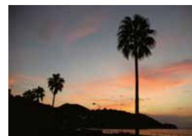
夕暮れ時の湯の児海岸もおおすすめです