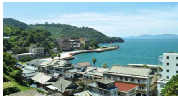
雄大な風景の湯の児温泉街を望む

海岸沿いにはホテル、旅館が立ち並び、展望露天風呂や新鮮な海の幸が楽しめる湯の児温泉。春は市街地から続く桜並木「チェリーライン」、夏には海水浴マリニアクティビティなど多くの家族連れ等々に賑わいます。ぜひ一度、バスで巡ってみませんか!?