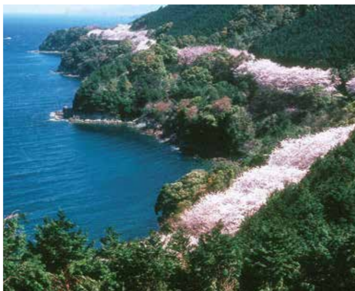
桜並木が水俣市街地から湯の児へと続く湯の児チェリーライン