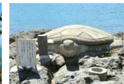
湯の児島にある願掛け亀