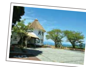
湯の児スペイン村福田農場