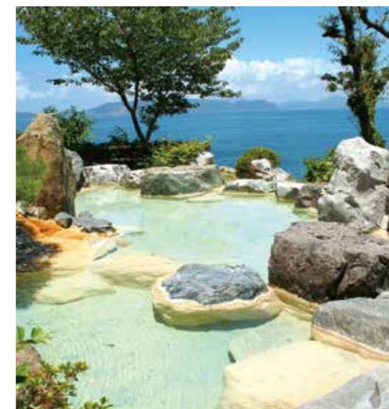
海を眺めながらの露天風呂も楽しめる湯の児温泉