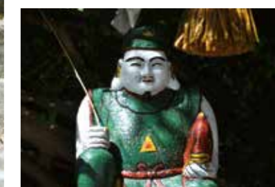
湯の児島の恵比寿様