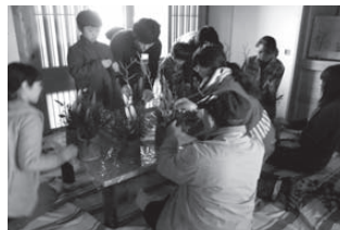
▲皆さんと一緒に門松を手作り

もうすぐお正月ですね！年の瀬が近づき、新年を迎えるための準備が始まる時期になりました。