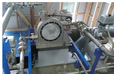
久木野寒川地区の小水力発電設備。寒川地区の振興に寄与しています。

平成26年から28年にかけて、久木野寒川地区の湧水を活用した小水力発電設備を、開発から現場据え付けまで手掛け