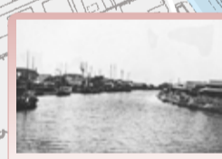
旧古賀川 左が古賀地区、右が浜地区