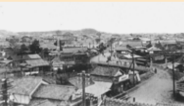
現在の国道3号線が通過するまでの旧水俣橋から日新町、浜本通りへ続く主要道。

現在の浜町周辺は、古くは戦国時代から町場として発展していた。江戸時代の末期頃には、水俣川の氾濫が繰り返されたことで、それまで上流の陣内を通過していた薩摩街道が、浜町へ付け替えられた。このことで、浜町周辺は、より水俣の人流・物流で栄える町となった。