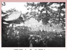
相撲大会の賑わい