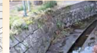
石の積み方にも注目。増設したり、途中で積み方が変わったりしている。

浜町周辺には、石積みの水路やその跡が多く見られる。水路は、旧河道に沿って緩やかなカーブを描くものや、真っ直ぐで整然とした古い道に沿うものがある。川のもたらす水運、水害の脅威に対応しつつ、整然とした町並を整えた商業の町の輪郭を伝えている。