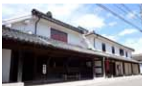
徳富蘇峰・蘆花兄弟が幼少時を過ごした生家。県指定史跡。

現在の浜町周辺は、古くは戦国時代から町場として発展していた。江戸時代の末期頃には、水俣川の氾濫が繰り返されたことで、それまで上流の陣内を通過していた薩摩街道が、浜町へ付け替えられた。このことで、浜町周辺は、より水俣の人流・物流で栄える町となった。