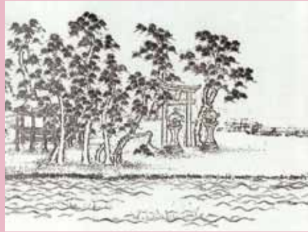
浜辺の松林の間に佇む八幡宮