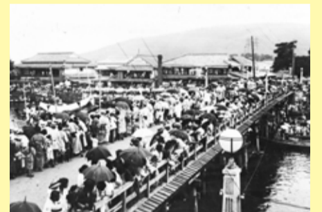
見物客で賑わう永代橋