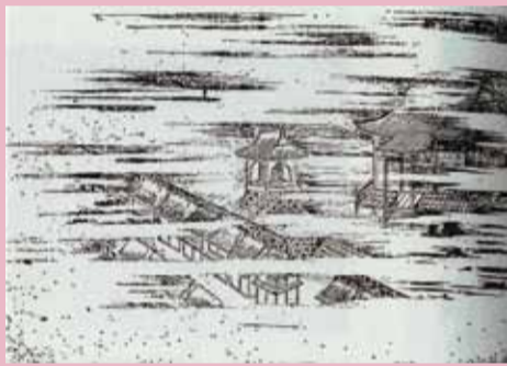
タもやに浮かび上がる源光寺