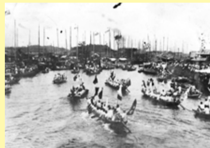
旧古賀川の河口周辺