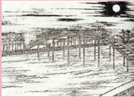
太鼓橋姿の永代橋