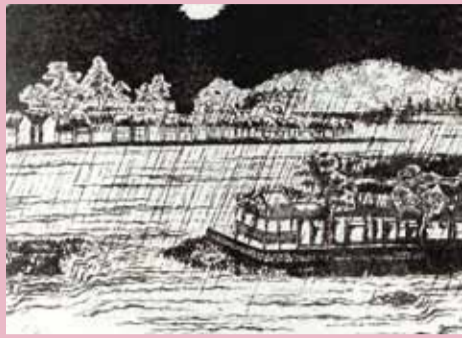
旧古賀川・旧洗切川の合流地点である洲崎