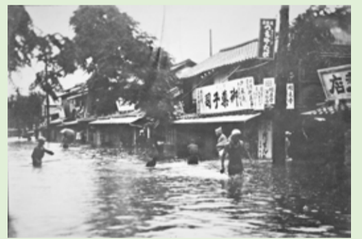
大正 12(1923)年：浜本通りの洪水被害