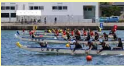
現在の競り舟大会(例年7月末頃開催)

夏の風物詩「競り舟」は、明治の中頃から始まったといわれ、河川改修前は旧古賀川で開催されていました。「一番出し」を出発点に、永代橋をくぐり抜け、現在の水俣郵便局付近がゴールでした。競り舟の日は、河岸や永代橋が見物客で埋め尽くされました。