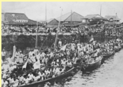
源光寺付近に集まる選手たち