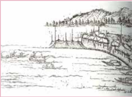
帰舟を迎える船津の漁村