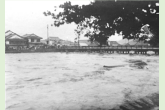
年不明：川の水面が橋桁に迫った永代橋

長らく水俣の経済・物流の中心を担った旧古賀川・旧洗切川の2河川は、河口の砂の堆積により、次第に大きな舟を付けられなくなり、度重なる洪水発生も大きな課題でした。このため、昭和7～9年にかけて2河川は1本に改修され、中洲は姿を消しました。物資の集散地としての役割は、同時期に修築が進められていた百間港などに移っていきました。