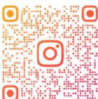
公式インスタグラム