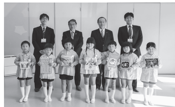
▲絵本を受け取った園児は大きな声でお礼をしていました

家庭での幼児と保護者の読書活動推進を目的とした、市の「よむよむセカンドブック事業」で、明光幼稚園の園児7人に絵本が贈呈されました。対象は市内に在住または市内保育園や幼稚園に在籍し満6歳に達する園児で、1人1冊、希望した絵本が贈呈されます。絵本を受け取った園児たちは大喜びで、来園していた保護者のもとに駆け寄っていました。同園は今年3月で閉園し、同月に閉園式を行う予定です。