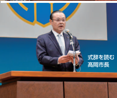
式辞を読む 高岡市長