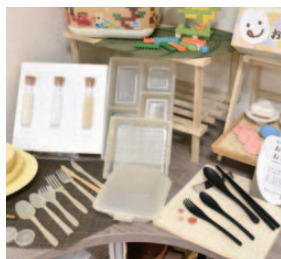
▲用途は多様で、環境に優しい素材として需要が増加しています

現在、当社で製造したライスレジン® を使用したカトラリーやレジ袋、歯ブラシなどが全国の飲食店や宿泊施設、小売店などで導入、販売され始めてきています。環境都市である水俣で、このようなバイオマスプラスチックを生産できることはとても有意義なことだと考えています。今後、「挑戦」をテーマに事業を発展させてまいります。