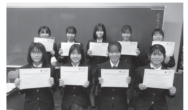
▲修了証が手渡されました

市は、令和2年度からベトナムの日越大学と水俣高校によるオンラインワークショップに取り組んでいます。この日、今年度の最終発表が水俣高校で行われました。同ワークショップは5月から全6回行われ、グループごとに設定したテーマに関する意見交換や、交流を深める中で、互いの国の文化や制度の違いを学びました。最後には修了証が手渡され、生徒たちは達成感に満ちた笑顔で受け取っていました。