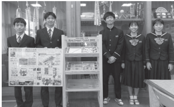
▲各中学校に寄贈しました（写真は水俣一中）

水俣高校電気建築システム科の生徒が、市産の木材で建具パンフレットラックを作成し、市内中学校4校に寄贈しました。 これは、水俣高校生徒、市内林業事業者、市内建具組合、水俣環境アカデミアが共同で取り組んでいる「木育ワークショップ」の一環として、生徒が木材加工技術の向上や地域産材活用の課題について学習し、知識を深めながら、木製家具の製作に取り組んだものです。