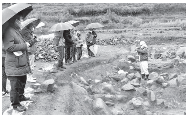
▲縄文時代の暮らしを語る遺物が、数多く出土しました

市教育委員会が令和2年度から久木野山上地区で行っている、山上遺跡発掘調査の現地説明会が行われました。 山上遺跡は大関山南麓の標高200m付近に位置する遺跡で、石器を中心に多くの縄文時代の遺物が出土しています。 当日は、調査機関である九州文化財研究所の調査員が、約60人の参加者に遺跡のことや遺物について詳しく解説。参加者らは縄文時代の人々の暮らしに思いを馳せました。