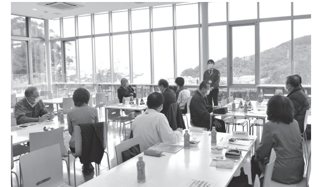
▲各社、それぞれが行っている取り組みを紹介

市が、河村電器産業(株)で市内の「よかボス」企業9社を集めて交流会を開きました。「よかボス」とは、自ら仕事と生活の充実を目指し、ともに働く従業員の仕事と生活の充実を応援するボス(会社の代表者など)のことで、県が進めている取り組みの一つです。交流会では、各参加企業の代表者が「充実した働き方を指すための工夫」や「社員の自主性を伸ばすために取り組んでいること」など、活発な意見交換を行いました。