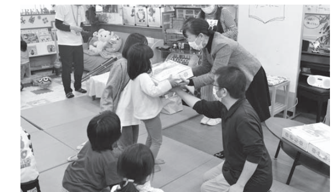
▲絵本の他、大人でも楽しめる書籍の開封もありました

絵本の読み聞かせなどを行う市内ボランティア団体「サニーにこ」による子どもたちへの絵本の読み聞かせが市ふれあいセンターで行われました。 子どもたちは工夫をこらした絵本の読み聞かせや、歌遊びを楽しみました。 最後に、新しい絵本などが詰まった箱が開封され、子どもたちは嬉しそうに手に取っていました。この絵本は第一生命保険(株)熊本支社水俣営業所が同センターに寄付した図書カードで購入されたものです。