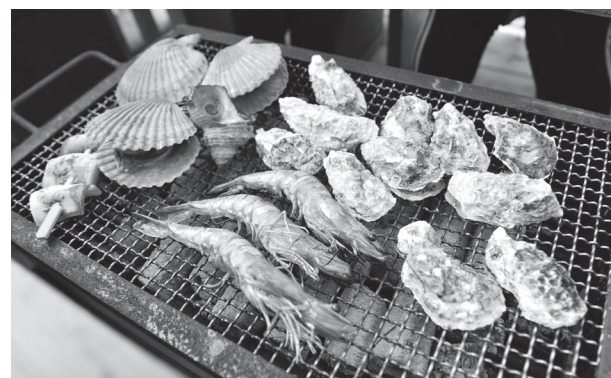
▲「恋路カキ」以外にも魚介を炭火で焼いて食べることができます

水俣産の新鮮な「恋路カキ」を味わえるカキ小屋が、道の駅みなまた裏の橋上に開店しました。恋路カキは水俣の海で育ったカキで、小ぶりながら濃厚な味と旨み特徴です。同店ではカキを1カゴ(10個〜15個)千円で販売している他、ヒオウギ貝やサザエ、エビ、カキ飯、じゃこ飯なども楽しむことができます。4月30日までの土日の営業を予定しており、営業時間は11時から16時(15時オーダーストップ)です。