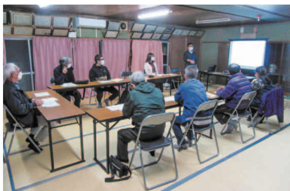
▲公民館で、地域包括支援センターの職員による、認知症の出前講座を開催。

まだスタート段階ですが、顔を合わせて話し合いを重ねることで、地域の課題や活動のヒントが見えてくるのではないかと考えています。また、以前から話し合われていた、公民館を拠点とした人と人がつながる仕掛けづくりにも取り組んでいきたいと思っています。