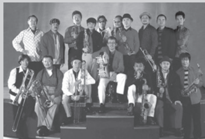
熱帯 JAZZ 楽団

★フラワースタンプカード4枚を一般前売券1枚と交換します。先着30人。詳細は、みなまたフラワースタンプ事業部へ ☎63-2788