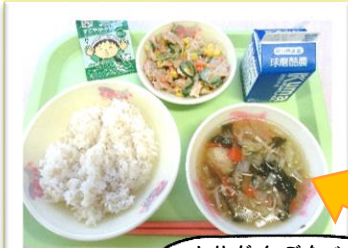
とりだんごなべ 鶏団子鍋