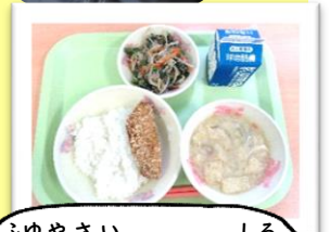
ふゆやさい 冬野菜のみそ汁