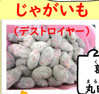
じゃがいも (デストロイヤー)