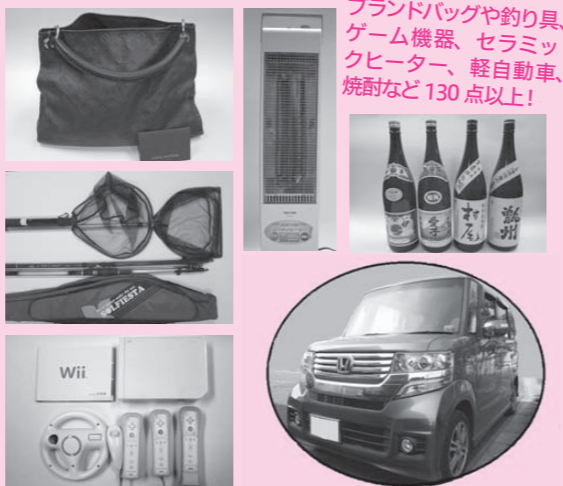
ブランドバッグや釣り具、ゲーム機器、セラミックヒーター、軽自動車、焼酎など130点以上!