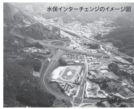
水俣インターチェンジのイメージ図

春と秋の2回狂犬病予防注射を行いました。今年度未接種の犬を対象に、今月初の試みとして日曜日に行います。狂犬病予防注射は、年に1回必ず接種を受けるよう、法律で定められています。狂犬