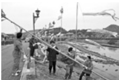
▲ 昨年の作業の様子

(社)水俣青年会議所では、毎年季節の風物詩として水俣川堤防沿いにこいのぼりを立てています。家庭で不要になったこいのぼりがありましたら、ぜひ提供してください。こちらから取りに伺います。問い合わせ (社)水俣青年会議所 ☎(62) 2890 (月～金曜日 10時～14時)