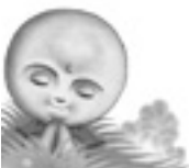
環境絵本「ひよっこりじぞう」 ©川崎のぼる