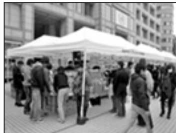
▲東京・青山で「あばあこんね」出店