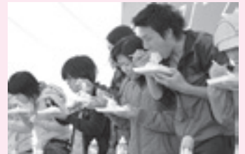
サラたまちゃん早食い大会