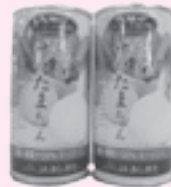
「飲むサラたまちゃん」 早飲み大会