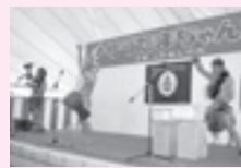
特設ステージでは、やうち ブラザーズや郷土芸能が 多数出演します!!