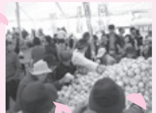
大好評! サラたまちゃん詰め放題