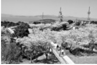
▲昨年完成した中尾山スカイロード