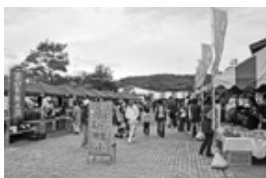
▲毎月第4土曜日開催のみなまた新鮮市

場所 道の駅みなまた(観光物産館まっぼっくり) 周辺 問い合わせ 農林水産振興課 ☎(61) 1634・観光物産館まっぼっくり ☎(62) 2003