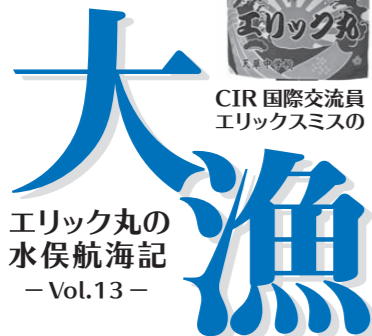
エリック丸の水俣航海記 - Vol.13 -

合衆国から離脱できるように銃の用意をすべきだと考えている。さて、昔のイギリスのように中央政府に逆らう時が来るか疑問に思っていたが、先月、ミズーリ州でこんな事件があった。武器を持たず、降伏した黒人少年が警察に射殺され、多くの市民が人種差別を訴える抗議活動を行った。まるで陸軍に見える重武装の警官隊が現れ、穏やかな抗議活動の参加者や記者に銃口を向け、デモを鎮圧した。近年、銃乱射事件が多くなった結果、銃の規制に関する議論が活発化した一方、この事件のせいで「差別的で、国の治安を維持できず、人の自由を奪う警察から自分の身を守るため、黒人の中でもっと銃を普及させよう」という反対の動きも始まっている。この事件から生まれた抗議活動が国中に広がり、人の怒りが鎮まる気配がない。長く銃による暴力で苦勞してきた同国人のため何とかしてあげたいけれど、遠く離れている日本からこの問題の解決に貢献する術がないと思い、心を痛めている。