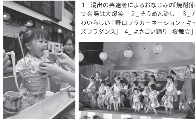
1_湯出の芸達者によるおなじみの「焼酎節」で会場は大爆笑 2_そうめん流し 3_かわいらしい「野口フラカーネーション・キッズフラダンス」 4_よさこい踊り「桜舞会」