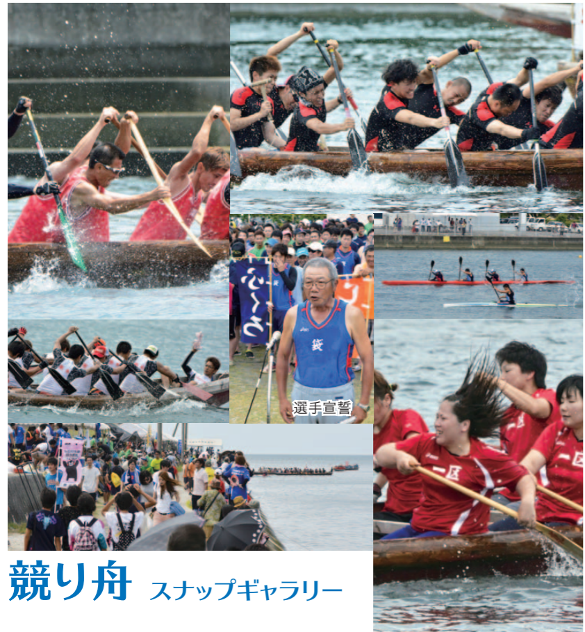
競り舟 スナップギャラリー