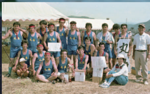
▲昭和61年に初優勝した丸島チーム

※本紙2～5ページに、今年の競り舟大会の結果や、競り舟の歴史も分かる特集フォトレポートを掲載しています。ご覧ください。