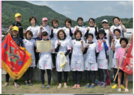
女子優勝 四区女子 1分37秒6 (6連覇) とにかく負けず嫌いなんですね。来年も負けないように練習します！ ▼2位以下の成績 ②22区、③3区、④市役所

大会用の舟は、長さ13メートルの木造。この舟に、はな先の「艇長」・中央の鐘たたき・かじ取りが各1人、こぎ手が14人の計17人が乗船します。艇長のかけ声と鐘の音に権を合わせ、ゴールを目指します。 レースは敗者復活ありのトーナメントで男女別。男女とも、水俣大橋下から河口に向けての直線300メートルでタイムを競います。各チームがそれぞれに練習を重ね、本番を迎えます。