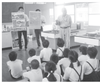
▲菜の花あかりづくり(一小)

リグラスに入った、やわらかなろうそくのあかり。このあかりは、水俣市内の使われていなかった田んぼや畑(休耕地)から生まれたんだって。市内のいくつかの小学校では、このあかりづくりのお手伝いをしてるんだよ! 寄ろ会のおじちゃんに話を聞いてみたよ。