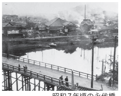
昭和7年頃の永代橋

【参考資料】新水俣市史、水俣市民競り舟大会復活10周年記念誌、同30周年記念誌 など