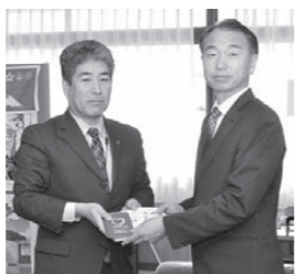
手帳を持って困っている人がいたら、声をかけてください。