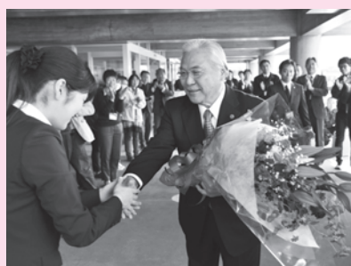
▲正面玄関前で職員から見送りを受ける宮本前市長