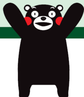
くまもとサプライズキャラクター くまモン

熊本県と県内市町村は、平成25年度から特別徴収義務のある全ての事業者の皆様に対して個人住民税に係る特別徴収の完全指定を実施しました。