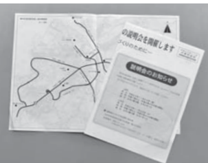
▲世帯配布「説明会のお知らせ」

現在、水俣市は熊本県と協働で水俣都市計画道路の見直しを行っています。 今回、都市計画道路見直しの素案について、説明会を開催します。 ■日時 11月29日(金)・30日(土) 19時～(18時30分開場) ※両日とも同じ内容です。都合が良い方へ参加してください。 ■場所 もやい館3階ホール ■内容 都市計画道路の見直しを行い、作成した素案についての説明会です。詳細は別途配布している「説明会のお知らせ」を確認してください。 ■問い合わせ 水俣市都市政策課 ☎61-1618