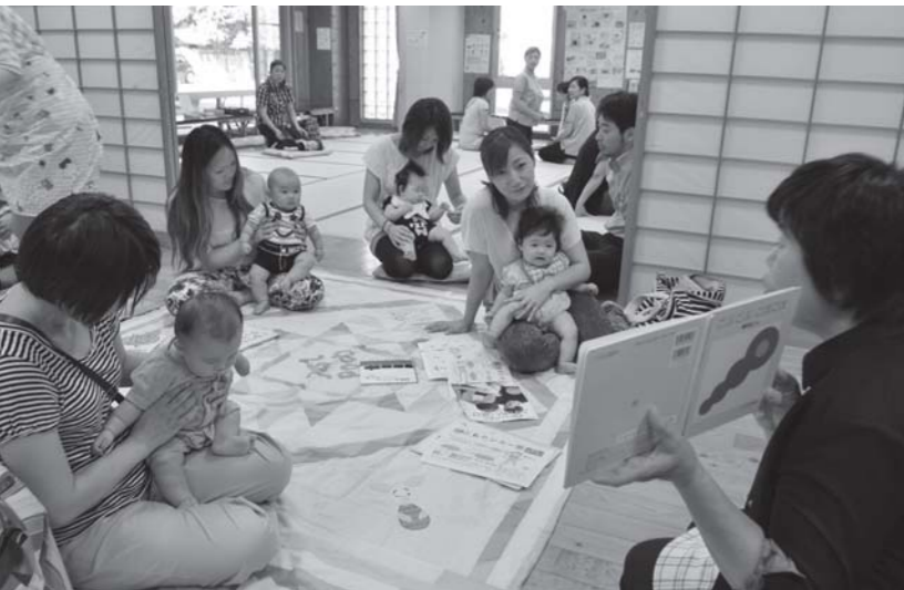
▲4カ月健診では、待ち時間に市立図書館やこどもセンターの職員が絵本の読み聞かせを行っています。