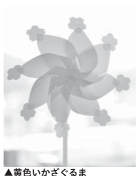
▲黄色いかざぐるま