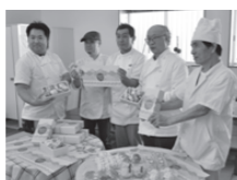
10月26日(土)・27日(日)、エコパーク水俣特設会場「豊かな海づくりフェスタ」では詰め合わせの販売も!