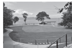
た奥の海が 改修した 広場に眺 める

● 自然地形を生かした公園づくり ● トイレのリニューアル ● 樹木の剪定による眺望の確保