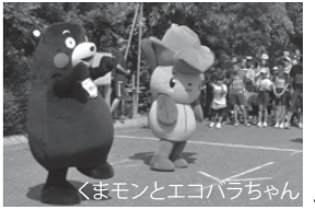
くまモンとエコバラちゃん

会場には、エコパーク水俣バラ園のマスケットキャラクター・エコバラちゃん、県のPRキャラクター・くまモンも駆け付け、参加者を応援。参加者はそれぞれのペースで、不知火海沿いの走りを楽しんでいました。