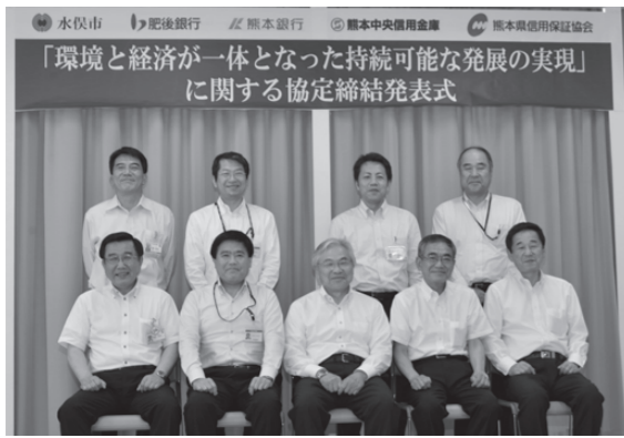
▲出席者で記念撮影