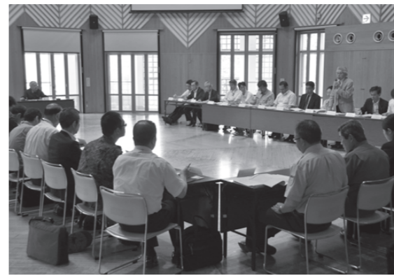
▲もやい館で行われた会議の様子

会議の前には、昨年発生した「7・12熊本広域大水害」の警察措置などの講演も行われました。