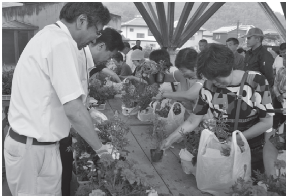
▲花の苗の無料配布。苗の一部は「身体障害者福祉協会連合会」の提供。配布は「市地域婦人会連絡協議会」の協力により実施。

配布には約2000人が訪れ、マリーゴールドやペチュニアの苗を持参した袋で持ち帰りました。会場では「緑のカーテン運動」として、アサガオの苗も配布しました。