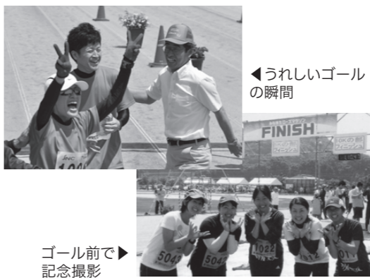
←うれしいゴールの瞬間