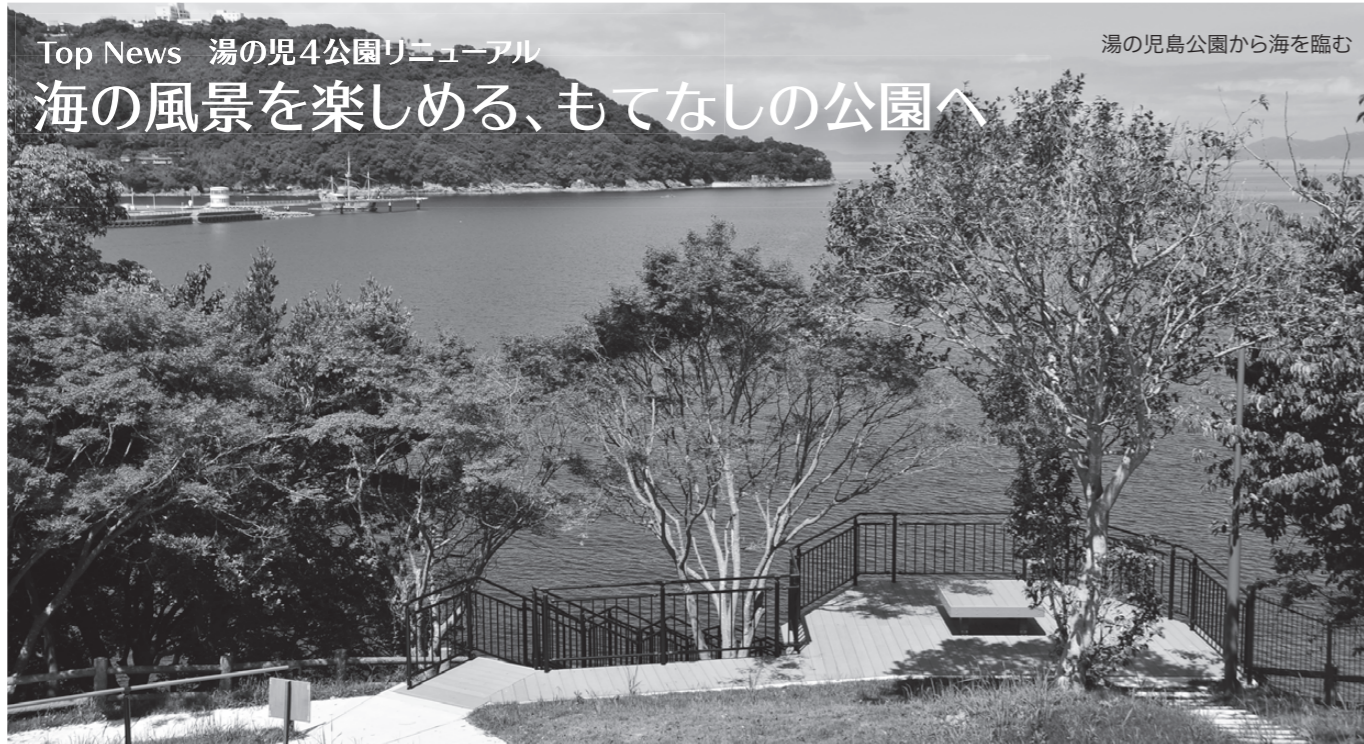
※4つの公園では、芝生養生中のため一部立ち入りを制限しています。表示のあるところには入らないよう、ご協力ください。