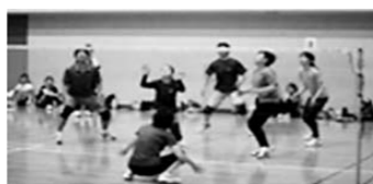
JNC杯ビーチボールバレー大会【7/7予定】

JNC株式会社は、地域の皆さまとのコミュニケーション、スポーツを通して健康で元気な地域づくり活動に努めています。