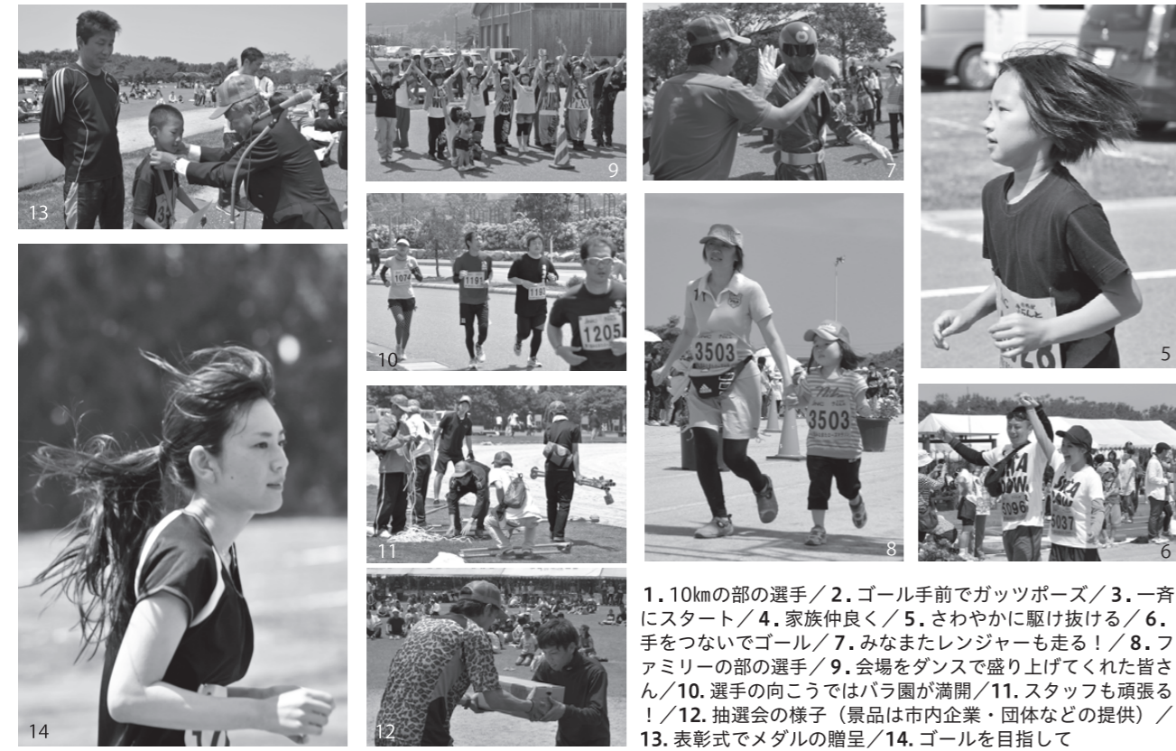
1. 10kmの部の選手 / 2. ゴール前でガッツポーズ / 3. 一斉にスタート / 4. 家族仲良く / 5. さやかに駆け抜ける / 6. 手をつないでゴール / 7. みなまたレンジャーも走る！ / 8. ファミリーの部の選手 / 9. 会場をダンスで盛り上げてくれた皆さん / 10. 選手の向こうではバラ園が満開 / 11. スタッフも頑張る！ / 12. 抽選会の様子(景品は市内企業・団体などの提供) / 13. 表彰式でメダルの贈呈 / 14. ゴールを目指して

初夏の陽気に包まれた5月12日、エコパーク水俣陸上競技場で、「天皇皇后両陛下下行幸啓記念第1回みなまたローズマラソン」が開催されました。地域活性化などを目的に、市陸上競技協会メンバーを中心とした同大会実行委員会が企画・運営したもので、ボランティア役員約120人の協力のもと、約800人が参加しました。