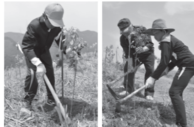
▲1本ずつ丁寧に ▲協力も大切