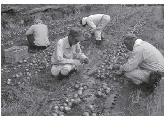
▲タマネギの収穫。今後は市内の小学生と農業の体験学習を実施予定。