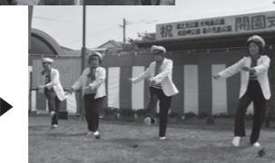
地元住民 による踊 りの披露