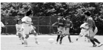
JNC恋龍祭カップ少年少女サッカー大会【7/27予定】