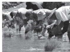
▲田植えは昔ながらの「手植え」で作業

6月17日には同所で田植えも行われ、1列に並んだ委員らが昔ながらの手植えで作業しました。