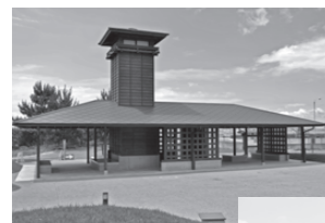
やぐら付き あずまや