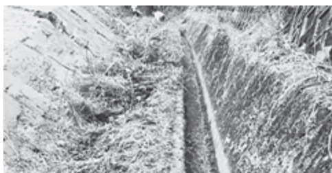
農業用水路の管理作業

また、日本一長い運動場線において大規模な改修を行う場合は、道路管理者や関係部署、地域の方々と情報共有を図り、農業用水施設の集約・再編も視野に入れた改修ができないか、探っていく。