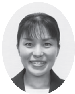
平岡 朱 議員 (日本共産党)