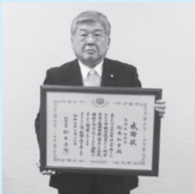
松本 和幸 議員 (77歳)