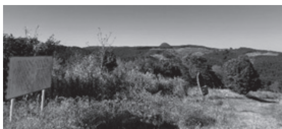
亀嶺峠からの景観

【問】 水俣だからこそ予防原則に立って動くべきでありこの計画は進めるべきではない。これだけの問題が心配されている。市長の態度をはっきりとさせるべきと思うがいかがか 【答】 環境影響評価の制度に則って懸念すべき点については意見を述べているので今後の動きを注視していく。