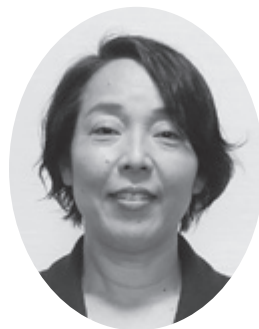
高岡 朱美 議員 (日本共産党)