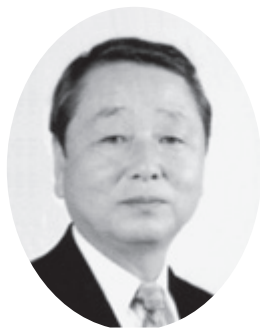
牧下 恭之 議員 (公明党)