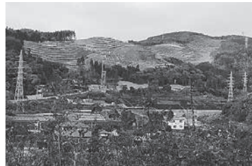
長野地区に建設中のメガソーラー施設

問 再エネ施設をめぐるとラブルが多発しており、全国で149の自治体が条例で抑制をはかっている。自治体として取りうる減災対策ではないか 答 市独自の条例制定は考えていない。