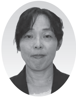
高岡 朱美 議員 (日本共産党)