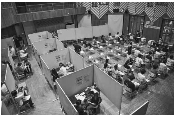
7月10日 もやい館で行われた集団予防接種