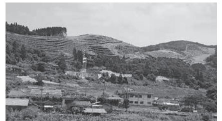
【太陽光発電施設現場】