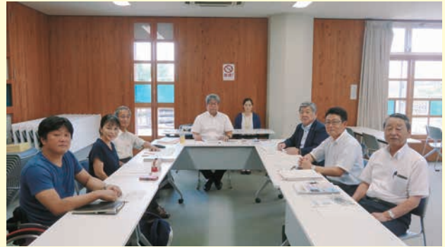
議会だより編集委員