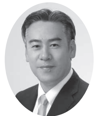
水俣市議会副議長

新庁舎建設も目に見えてきました。これをスタートとして、さらに大きく水俣の発展と、市民の皆様が安全・安心に暮らせる我が郷土を、皆様とともに築いてまいります。どうぞよろしくお願申し上げます。