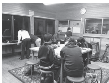
放課後おさらい教室

答 当事業は、雇用機会創出のために企画されたものであり、継続中止の判断に口を挟む立場にない。 問 水俣市も補助金を出していた。利用者は皆子どもの学習意欲が向上したと喜んでおり、再開を強く望んでいる。豊後高田市は、すべての子どもたちを対象に放課後学習支援をしている。自治体でもやろうと思えばやれるが 答 市として特定の地域や校区を対象とした事業はできない。現在全学校で実施している放課後補充教室を充実させていく。