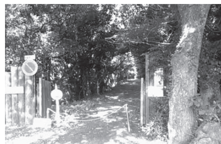
グリーンスポーツ水俣入り口