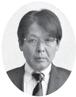
岩村 龍男 議員 (自由民主党 自民会派)