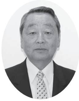
牧下 恭之 議員 (公明党)