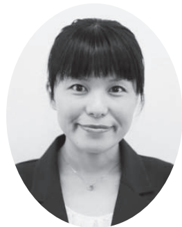
平岡 朱 議員 (日本共産党)