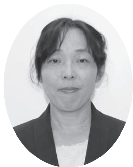
高岡 朱美 議員 (日本共産党)