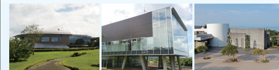
熊本県環境センター 水俣病情報センター 水俣病資料館

まなびの丘とは、熊本県環境センター、水俣病情報センター、水俣病資料館を含む周辺地域の総称です。